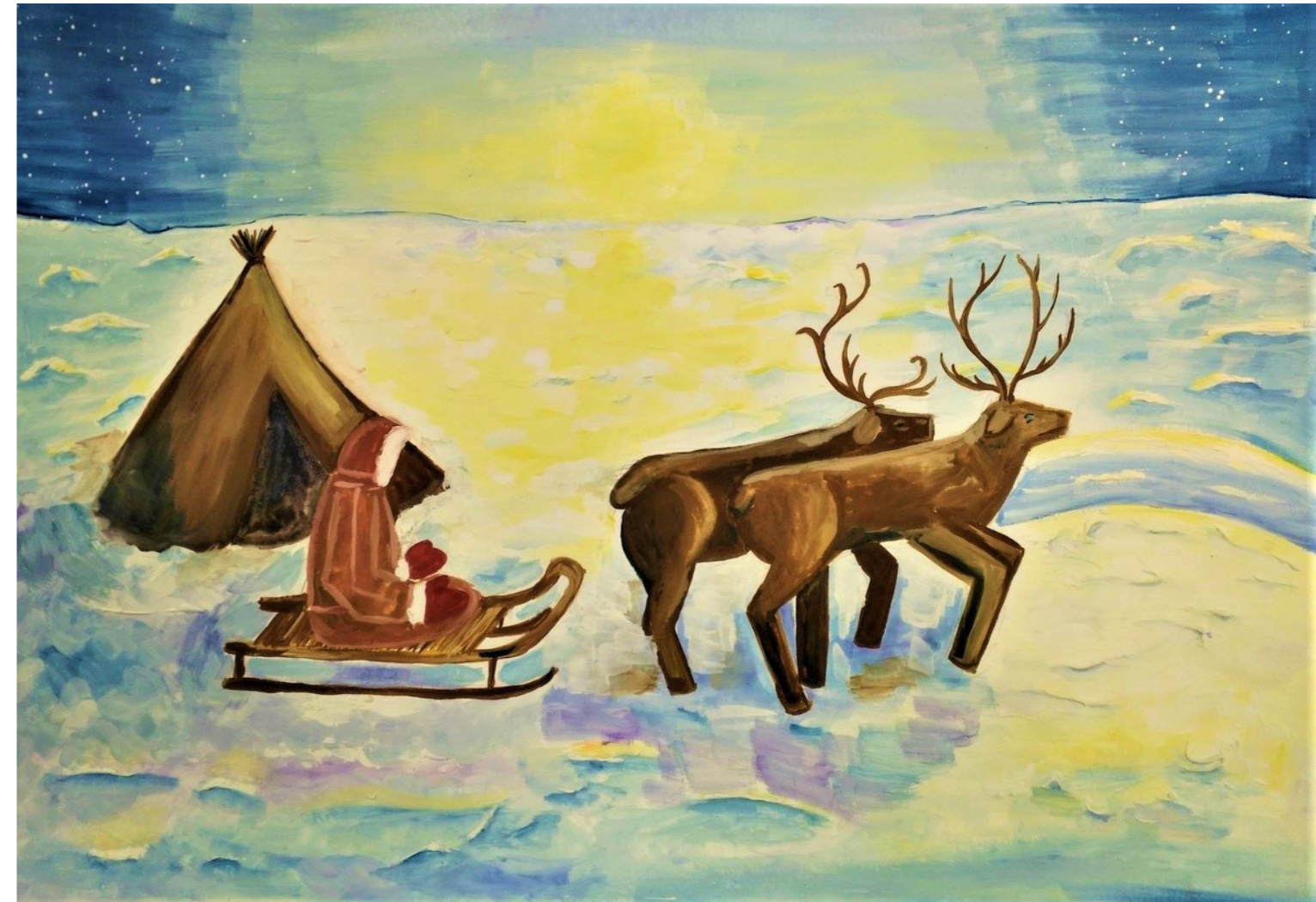
Семенец, Лера. «Ночь тундры»

Оланiнсö бурджыкöс оз бöрйы. ...Мыйкö мында ми тшöтш - Войвыв көръяс.