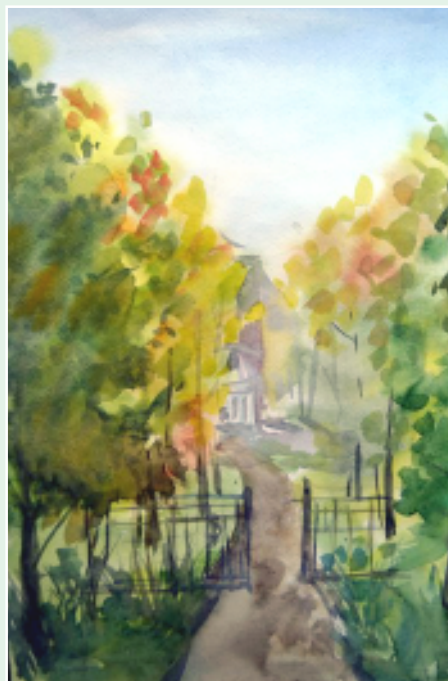
Рисунок Марии Мишариной

Так и узнала Ира о чудесном саде. А когда подросла, стала ухаживать за садом, как бабушка.