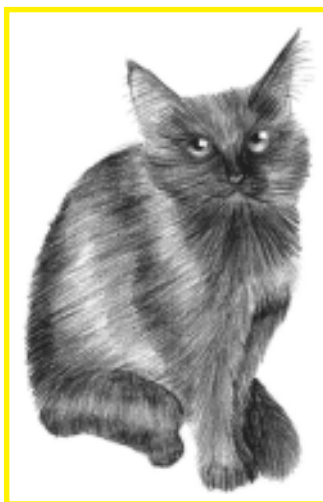
Рисунок Виктории Моториной

Я маленький человечек. Я маленький щенок. Я живу и дышу свободой, И пылью дальних дорог. А может быть, я — солнце, Или далёкий Сатурн? А может быть, я ветер, Мечтающий слухть гору? А может быть, я — дочка Лучшего в мире отца? Я живу далеко за морем И жду своего конца.