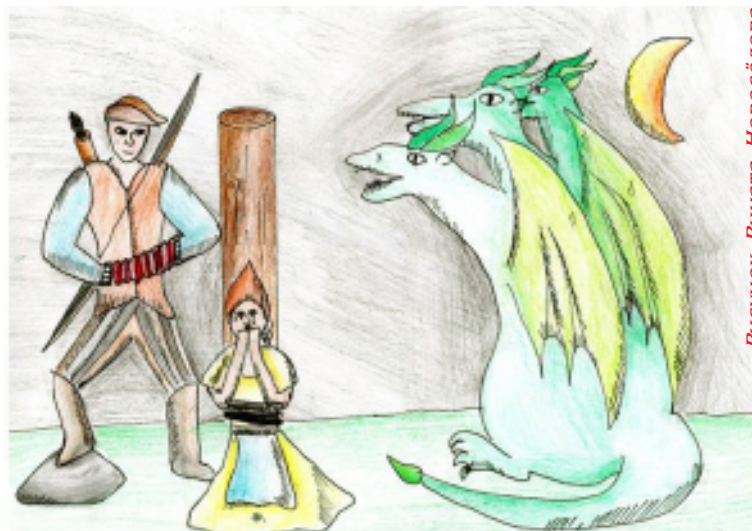
Рисунок Рината Новосёлова

И начал Ыджыд-морт играть колыбельную песню на гармошке, и Гундыр заснул. Пока Гундыр спал, Ыджыд-морт освободил Мичу и запустил стрелу Гундыру в головы. Так и убил Ыджыд-морт Гундыра. Жили они долго вместе с Мичей. Она нарожала Ыджыд-морту много детей, и жили они всегда счастливо, душа в душу.