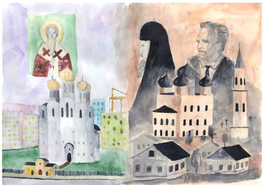
Сохраняя традиции, строим будущее. Рисунок Алексея Лютеева. Педагог И.А. Витязева.