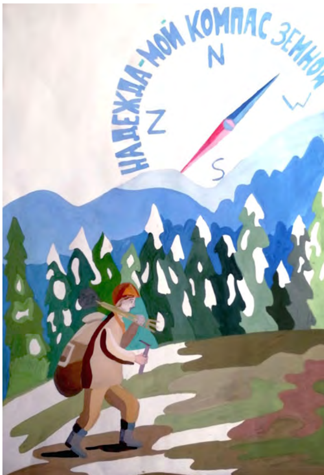
Рисунок Елизаветы Размысловой. Педагог И.А. Витязева.