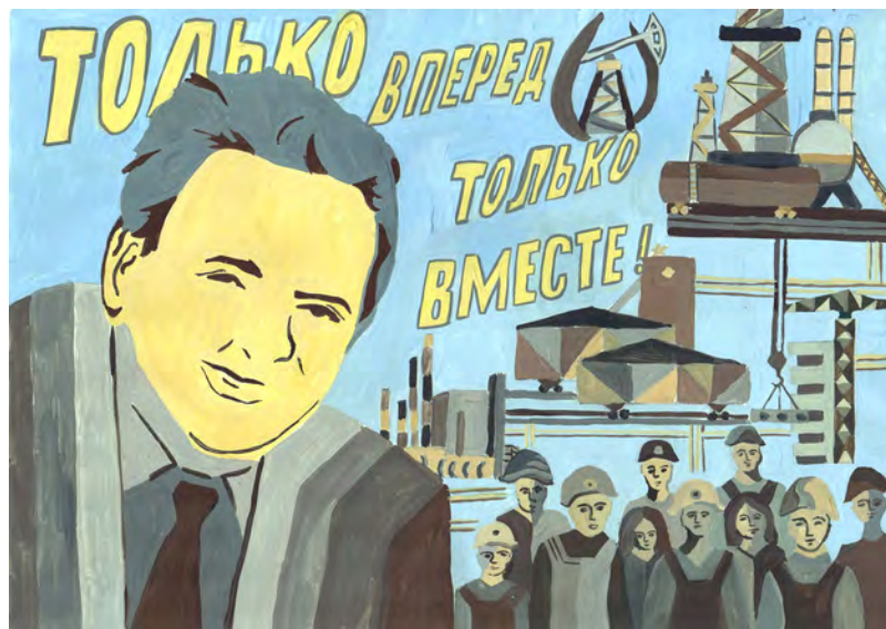
Рисунок Валерии Оверченко. Педагог В.Н. Езовских.

История рода давала свои нравственные уроки и зада-