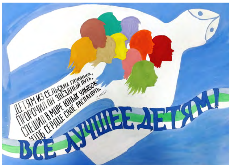
Рисунок Киры Ляшенко. Педагог И.А. Витязева.

Эта маленькая история случилась на отчётном концерте Гимназии в 1997 году. Тогда, конечно, у нас ещё не было своего концертного зала.