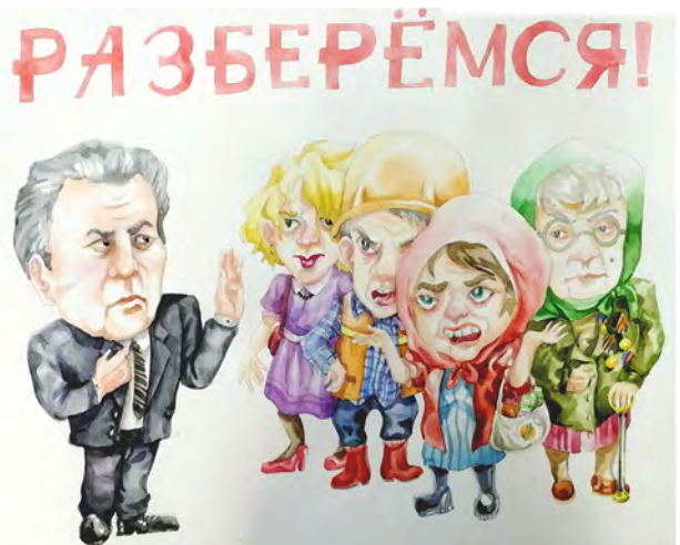
Рисунок Дарьи Чикариной. Педагог И.А. Витязева.