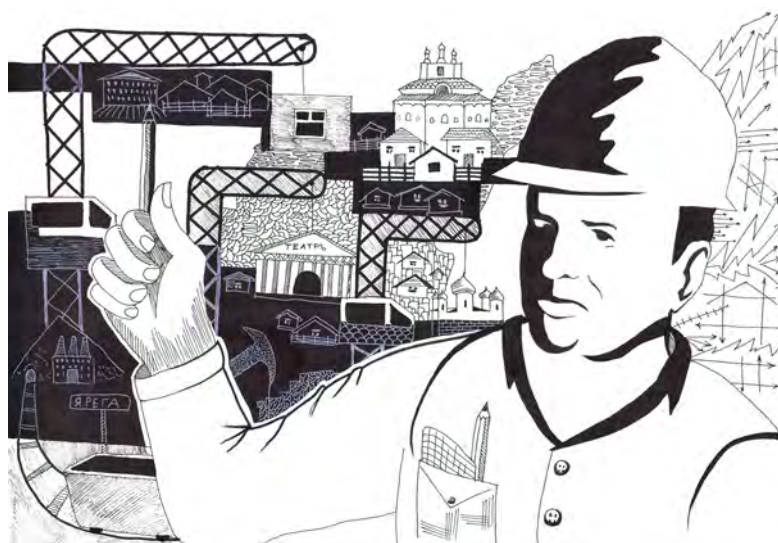
Строительство шахты в Яреге. Рисунок Рината Новосёлова. Педагог В.Н. Езовских.

Я во все глаза смотрю на дядю и вспоминаю прочитанные строки из книги Т.Т. Новиковой «Юрий Спиридонов. Дорога в жизнь»: мальчик