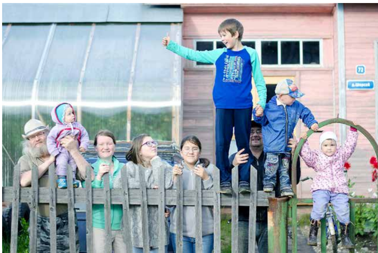
Сыктыв районса Межадор сиктын.