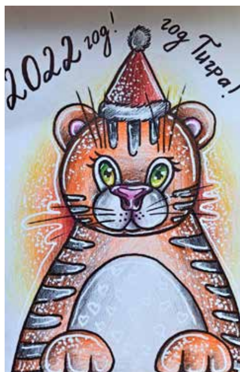
Рисунок Аглаи ЛОБАНОВОЙ