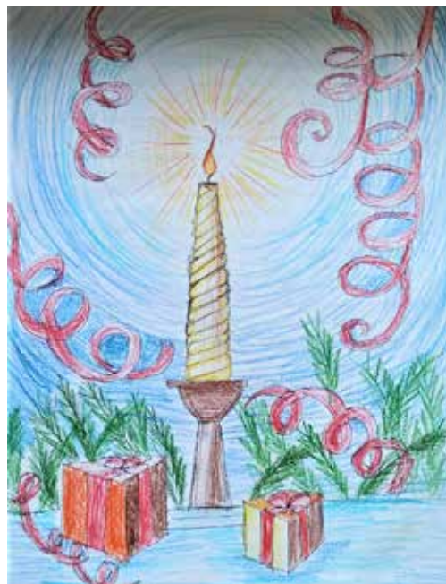
Рисунок Юлии ЛЕБЕДЕВОЙ