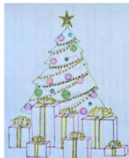
Рисунок Элины КЕТОВОЙ