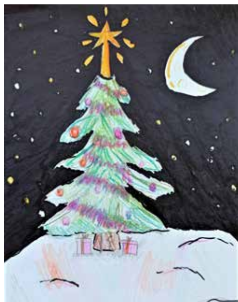
Рисунок Егора ВИТЯЗЕВА